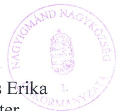
Hajduné Farkas Erika polgármester