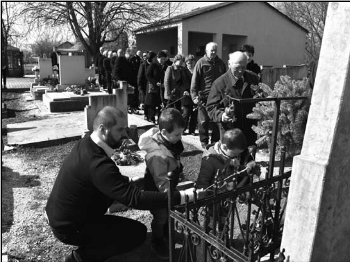
A megemlékezők is elhelyezték virágaikat a mártír lelkészek sírjainál.

1848-49-es eseményekre. A megemlékezés zárásaként a Nagyigmándi Lovaskör huszárai koszorúzták meg a sírokat.