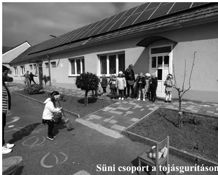
Süni csoport a tojásgurításon