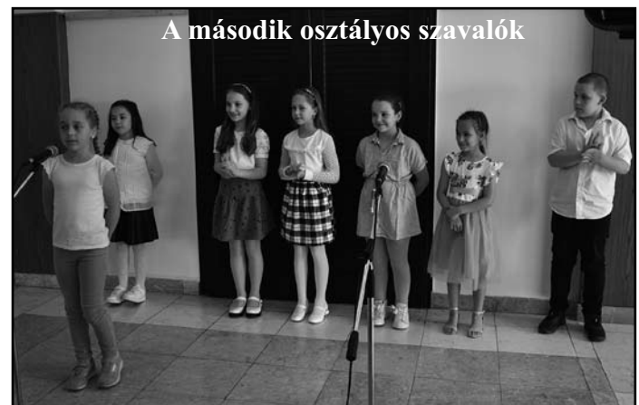
A második osztályos szavalók

egy vers is, pláne vészterhes időkben! Ne legyenek illúzióink: nyilván nem a költészet fogja megoldani a világjárványt, de felelősebbek igenis lehetünk a segítségével – hiszen