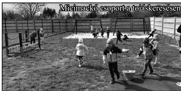
Micimackó csoport a tojáskeresésen