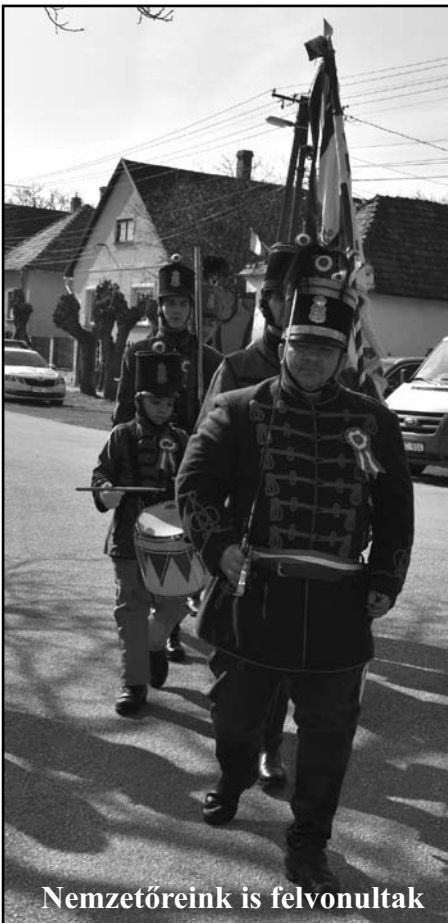
Nemzetőreink is felvonultak