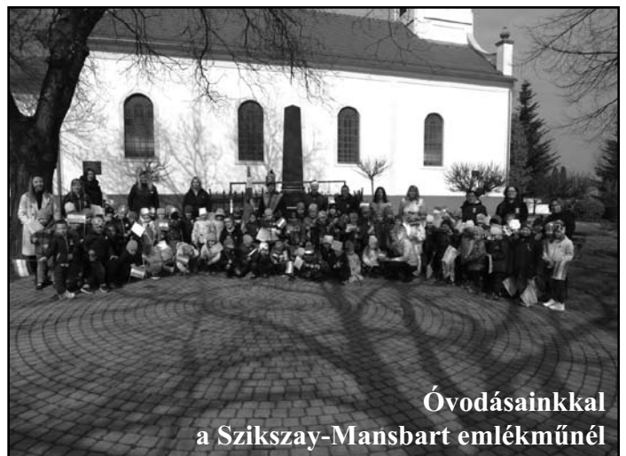
Óvodásainkkal a Szikszay-Mansbart emlékműnél

Foglalkozásaink alkalmával készített lobogókkal, kabátjainkra tűzött kokárdákkal vonultunk végig a főutcán, a Szikszay-Mansbart-emlékműhöz