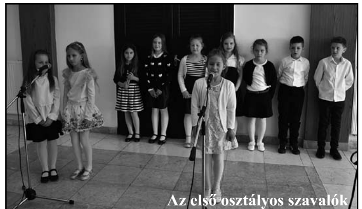
Az első osztályos szavalók

kező esetben ma nem lenne se zene, se barlangrajz, se költészet. Ha tehát a költészetet nemcsak l'art pour l'art szórakozásnak tekintjük, akkor bizony kapaszkodó lehet egy-