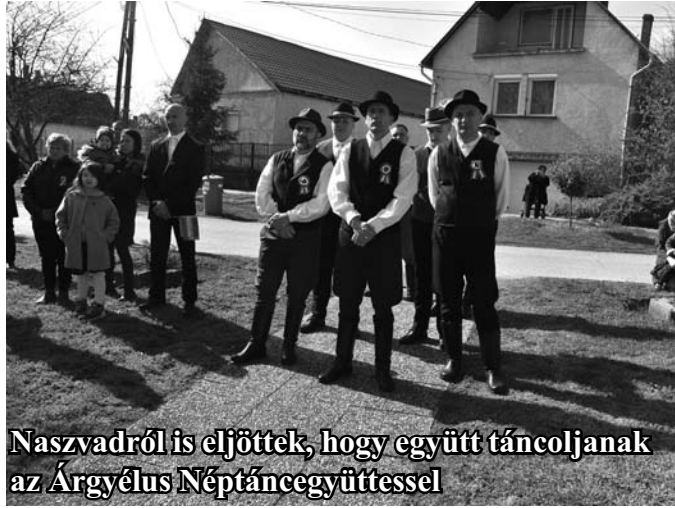
Naszvadról is elfjöttek, hogy együtt táncoljanak az Árgyélus Néptáncgyűttessel

A műsort követően az Árgyélus Néptáncgyűttes és a naszvadi Pettyem Néptáncsoport férfi tagjai verbuváló táncot mutattak be. A rábaközi körverbunkban helyet kapó fiatal fiúk számára ez a felnőtt férfikor kezdetét is jelentette, illetve a "hejlegény" által vezényelt verbunk a katonai regulákhoz hasonló fegyelmezettséget követelt minden táncostól. A rábaközi falusi legény vagy férfi így tehetett bizonyosságot a verbuválók előtt rátermettségéről és fegyelmezettségéről.