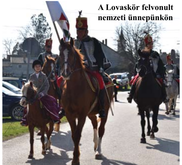
A Lovaskör felvonult nemzeti ünnepünkön