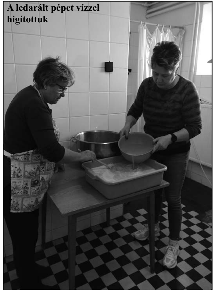
A ledarált pépet vízzel hígítottuk

kicsírázott gabonát nedvesen megdarálják húsdarálón és a törmeléket langyos vízben mossák-kiáztatják. Az így nyert fehér színű „csíras lé” a csíramalé alapanyaga, amelyet közönséges rozsvagy búzaliszttel tésztává kevernek. A tésztát vékony rétegben sütik meg.