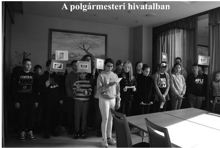
A polgármesteri hivatalban

Első „bevetésünkre” a polgármesteri hivatalban került sor. Egy rövid bevezető után (miért éppen ezen a napon ünnepeljük a költészet napját) szép idézetek hangzottak el versekkel, versmondással kapcsolatban. A kis műsort közös szavallat zárta: a kedves, mosolyról szóló verset együtt mondták el a „kommandósok”. Polgármester Asszony és az Önkormányzati Hivatal munkatársai hálásan fogadták a produkciót, melyet tapssal és apró ajándékokkal köszöntek meg.