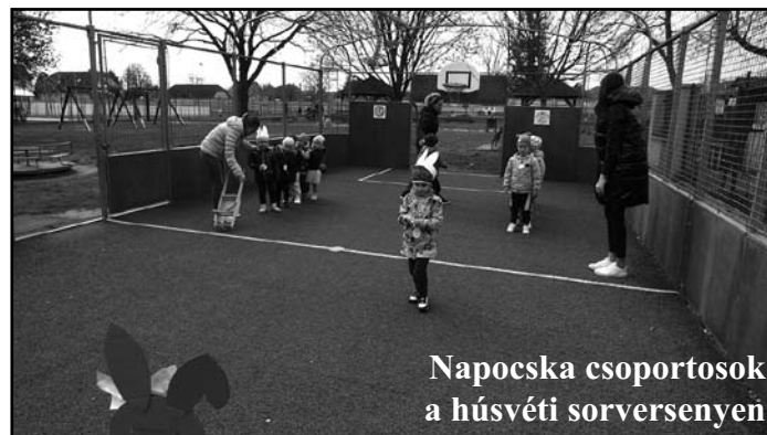
Napocska csoportosok a húsvéti sorversenyen