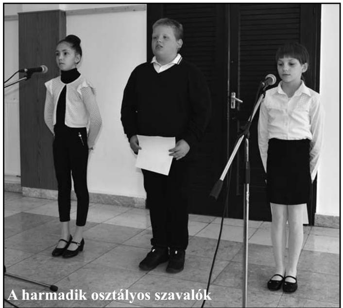
A harmadik osztályos szavalók