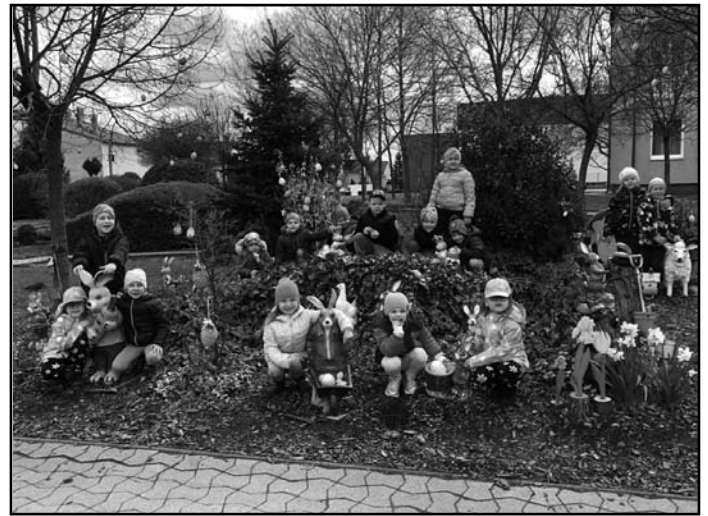
Pillangó csoport a húsvéti parkban

inkkal. Megtekinthettük, hogy zajlik le egy óra, mit csinálnak a gyerekek, milyen könyvekből tanulnak. Bevonták óvodásainkat a feladatokba, ahol mindenki ügyesen helyt állt.