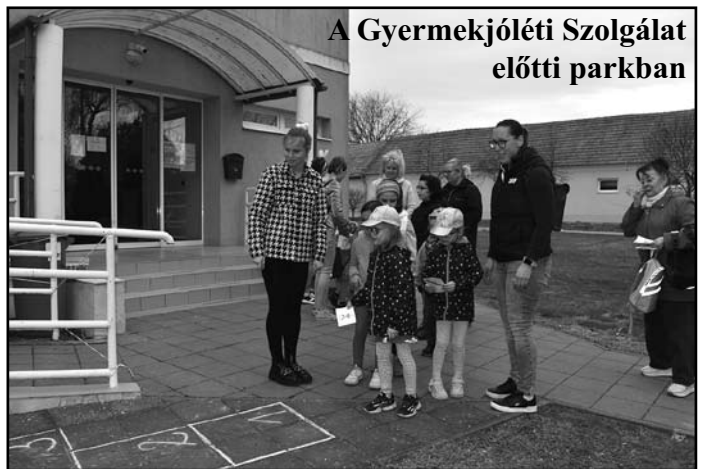
A Gyermekjóléti Szolgálat előtti parkban