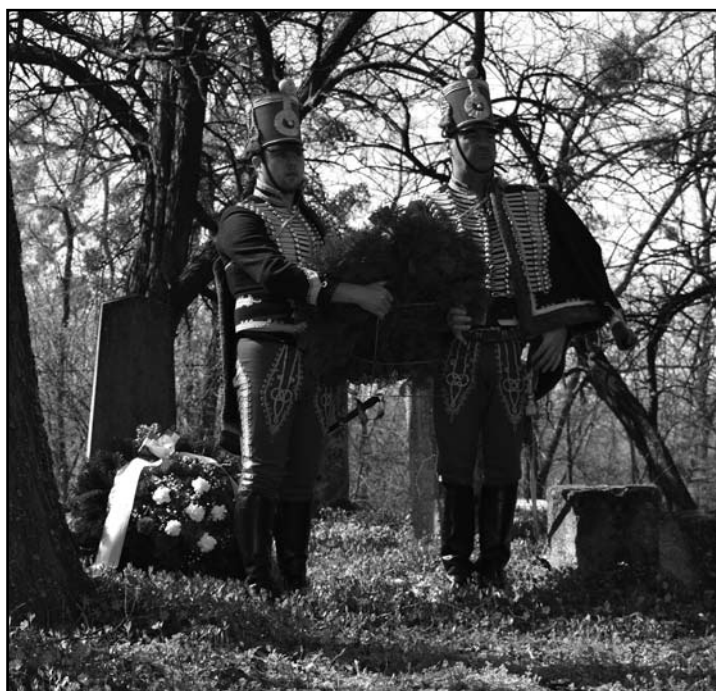
A Lovaskör koszorúzott Szentmihály-pusztán