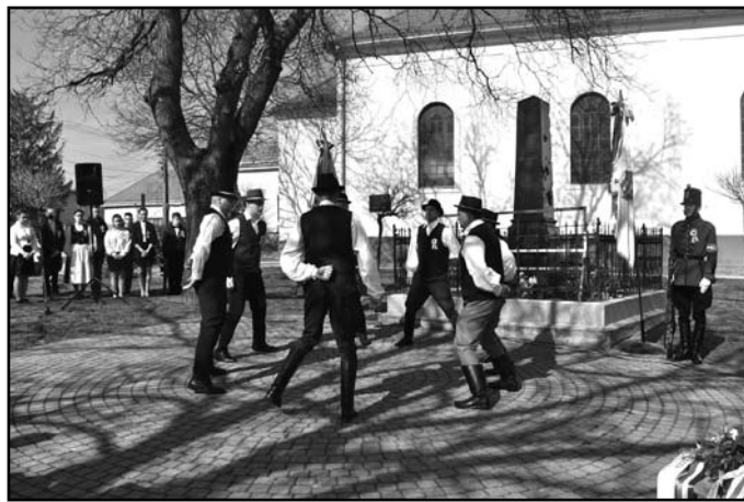
Árgyélus Néptáncgyűttes és a naszvadi Pettyem Néptáncsoport férfi tagjai verbuváló táncot mutattak be