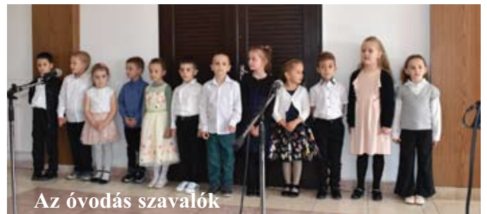
Az óvodás szavalók