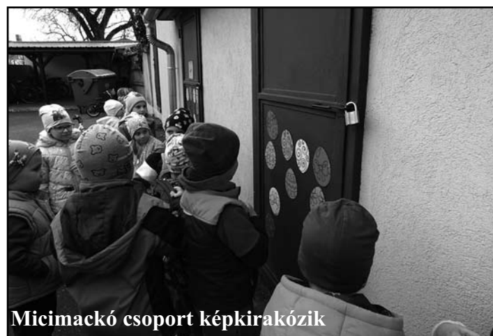
Micimackó csoport képkirakózik