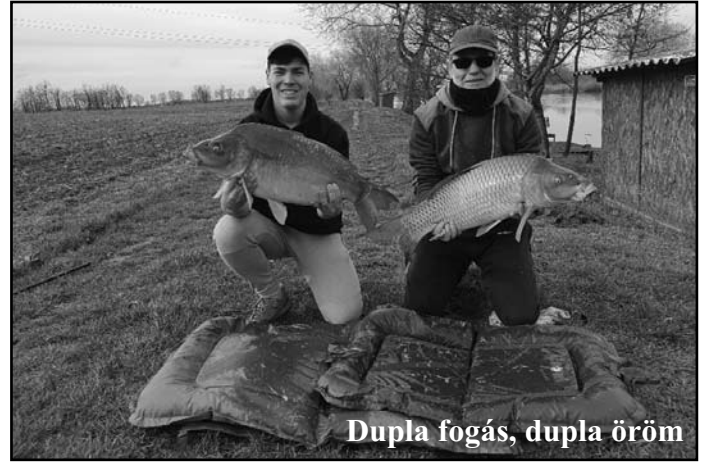
Dupla fogás, dupla öröm