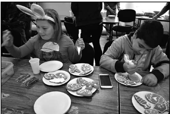
Szépeket alkottak a gyermekek