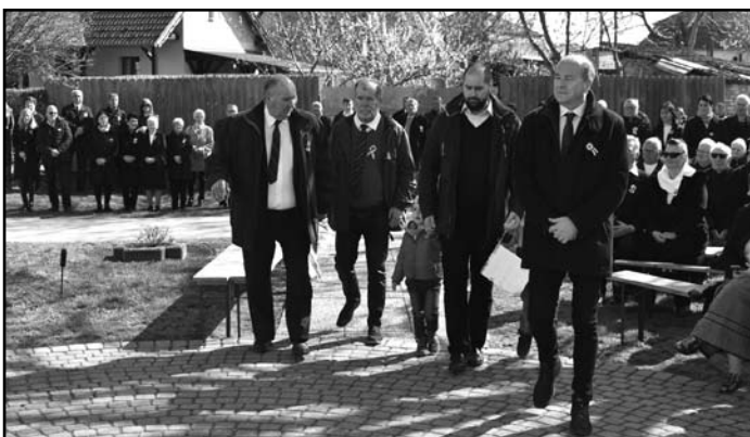
A Manschbarth család is elhelyezte koszorúját