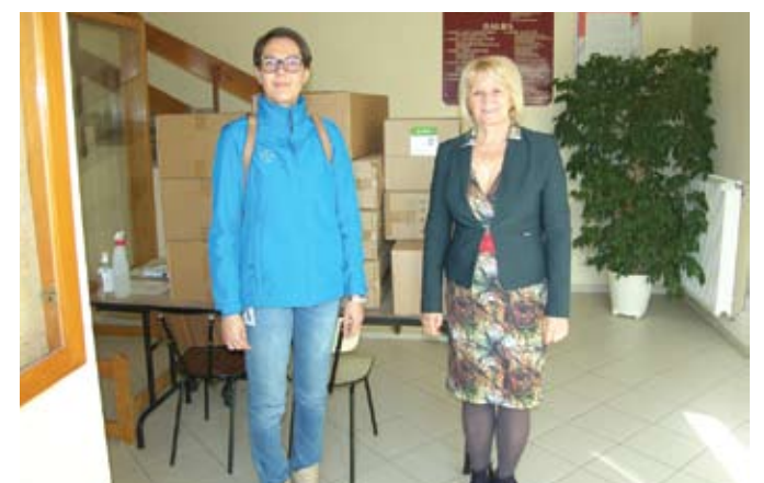
A Bayer Hungária Kft. egészségügyi maszkokat adományozott önkormányzatunk részére