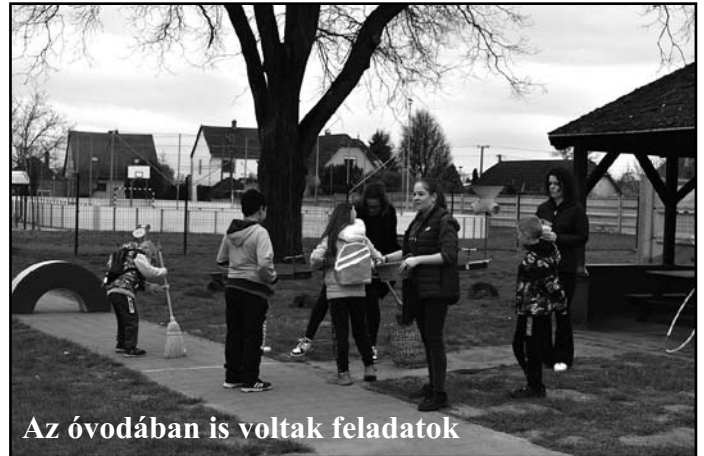
Az óvodában is voltak feladatok

keresőt” tartottunk. Három helyszínen (Gyermekjóléti Szolgálat, Kincseskert Óvoda és a Magos Könyvtár) kellett a gyermekeknek játékos feladatokat teljesíteni és ezért a „Nyuszi szigeten” nyuszi csomagot vehettek át. A feladatok között volt ugróiskola, akadálypálya, tojásgurítás, tojás keresés, kanállal tojás szállítás a könyvtári polcok között. Akik sikeresen