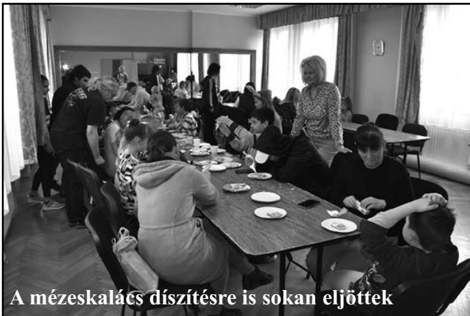
A mézeskalács díszítésre is sokan eljöttek