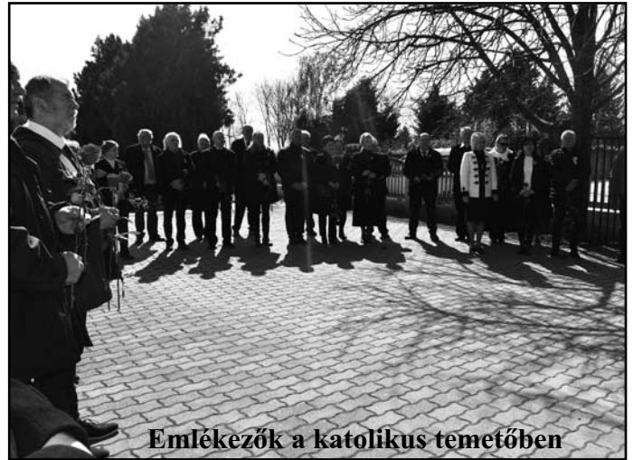
Emlékezők a katolikus temetőben