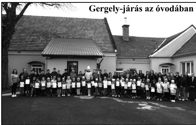
Gergely-járás az óvodában

Idén március 12-én, kedden érkeztek Gergely pápa és katonái a nagycsoportos gyermekeinkhez, akik már egész héten nagy izgalommal várták vendégeinket. Óvodásaink verssel mutatták meg azt, hogy készen állnak az előttünk álló iskolás évekre. Az ezt megelőző héten foglalkozásainkon beszélgettük az iskolai élet mindennapjairól, ezzel egy kis betekintést kaphattak a gyerekek arról, milyen is a diákélet. Miután átadta Gergely pápa engedélyét az iskolakezdéshez-nagy izgalom következett, ugyanis meglátogathattuk az általános iskola első osztályos gyermekeinek egy tanóráját. A tanító néik nagyon kedvesek és segítőkészek voltak óvodása-