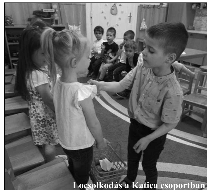
Locsolkodás a Katica csoportban