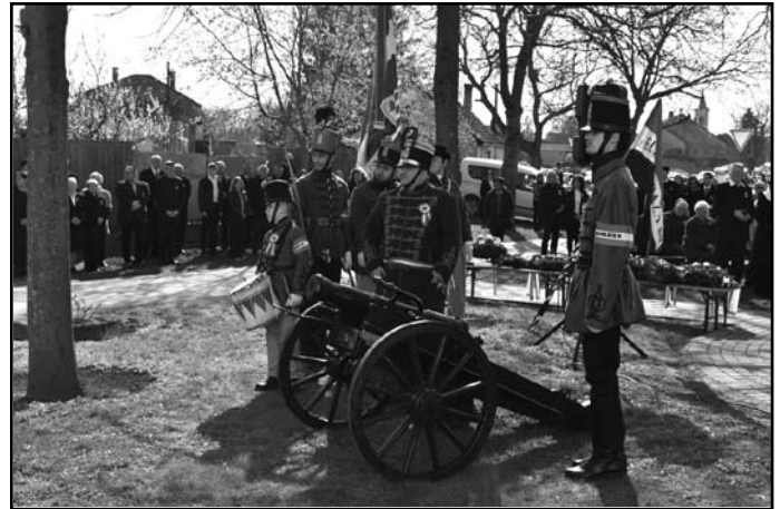
Nemzetőreink ágyút lőttek