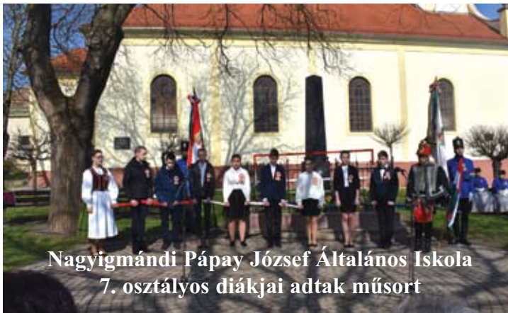
Nagyigmándi Pápay József Általános Iskola 7. osztályos diákjai adtak műsort