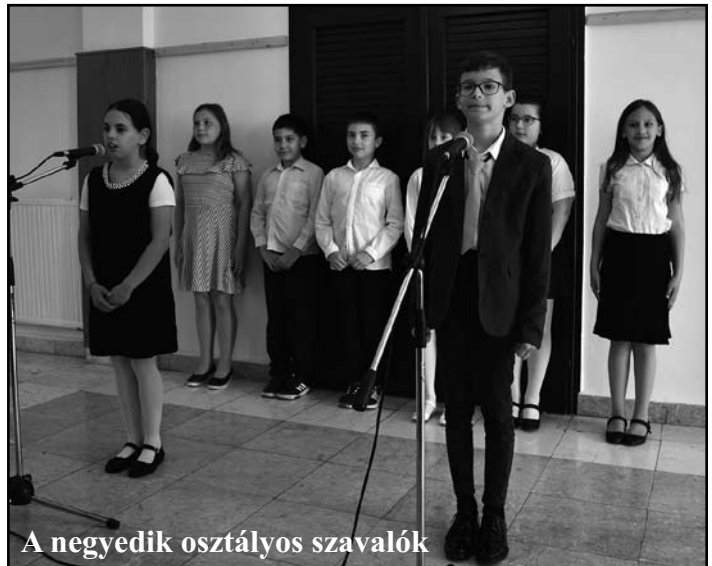
A negyedik osztályos szavalók